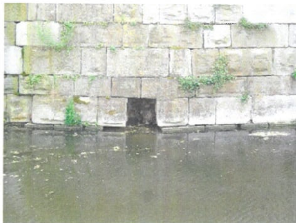
juni 2016, stenen vallen uit