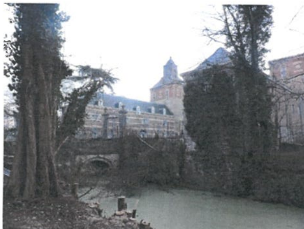
januari 2015, muur buikt uit

Amsterdam 020 6215 1341 Maastricht 043 3834210 Utrecht 030 6534411 www.hvna.nl