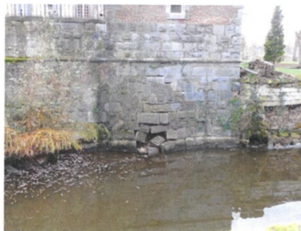
1 december, plaatselijke instorting