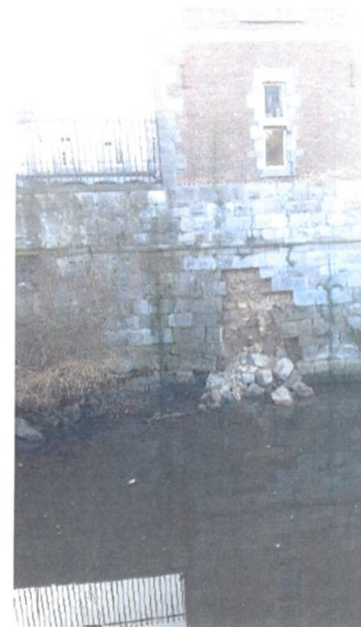
16 december 2016, instorting vergroot